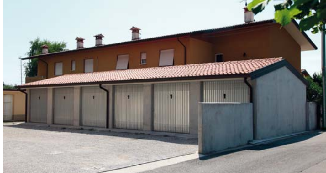
Esempi di complessi prefabbricati a schiera per autorimesse condominiali.