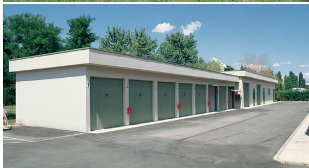
Complesso prefabbricato a schiera per garage e magazzino.