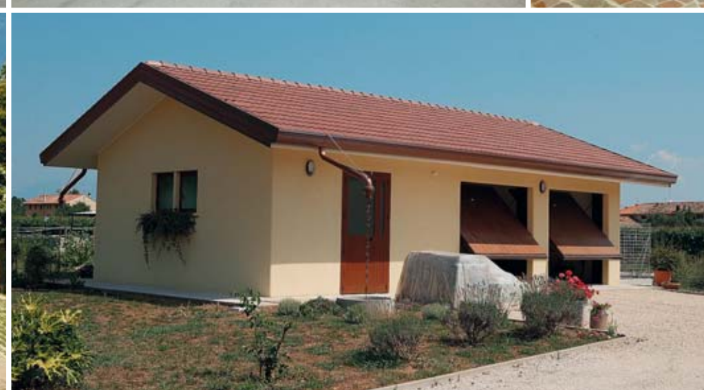
La Cement-Edil realizza prefabbricati che grazie alle loro caratteristiche tecniche ed estetiche si integrano in modo armonico nell'ambiente.