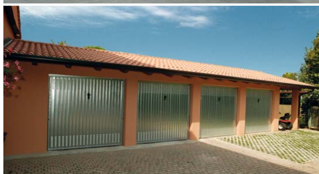
Complesso prefabbricato a schiera copertura a due falde con orditura in legno.