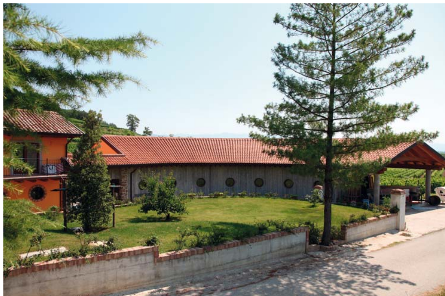
DANTONI 340 8108802

La componibilità del sistema è tale da lasciare libero spazio alla fantasia e alle esigenze funzionali permettendo varie destinazioni d'uso.