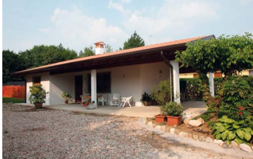
Esempio di come si possono integrare le moderne strutture prefabbricate nei contesti rurali.