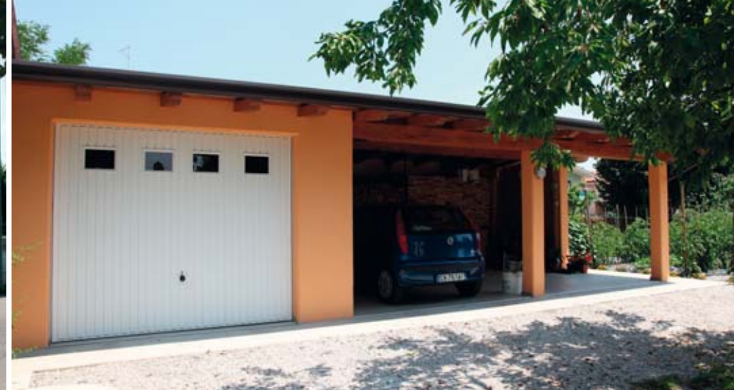
Garage con svariate soluzioni di copertura per soddisfare l'inserimento nel contesto urbanistico.